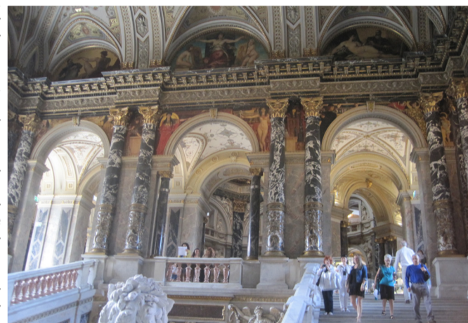
Вена. Музей истории искусств

Но Брейгель не был бы Брейгелем, если бы его картины не назывались настоящей «энциклопедией». Его кисти принадлежит картина «Фламандские пословицы», где в аллегорической форме изображены более 100(!) пословиц и поговорок, популярных в Голландии 16 века. Например, «он кроет крышу блинами», т.е. живет на широкую ногу, расточительствует. Еще одно масштабное полотно «Детские игры» представляет более 250 детей, играющих в более чем 130 различных игр. Написанные с высокой точностью и мастерством персонажи помогают представить, как выглядели и жили люди 5 веков назад. Брейгель, как и многие художники Северного Возрождения, уделял огромное внимание библейским сюжетам. Причем помещал их в современную художнику обстановку, нередко проводя параллель с событиями, свидетелем которых стал. Так, картина «Вавилонская башня» из собрания Венского музея истории искусств служит поучительным примером для жителей города Антверпена. Пробразом монументальной башни на полотне стала смотровая башня в центре города. А многонациональный и разноязыкий торговый